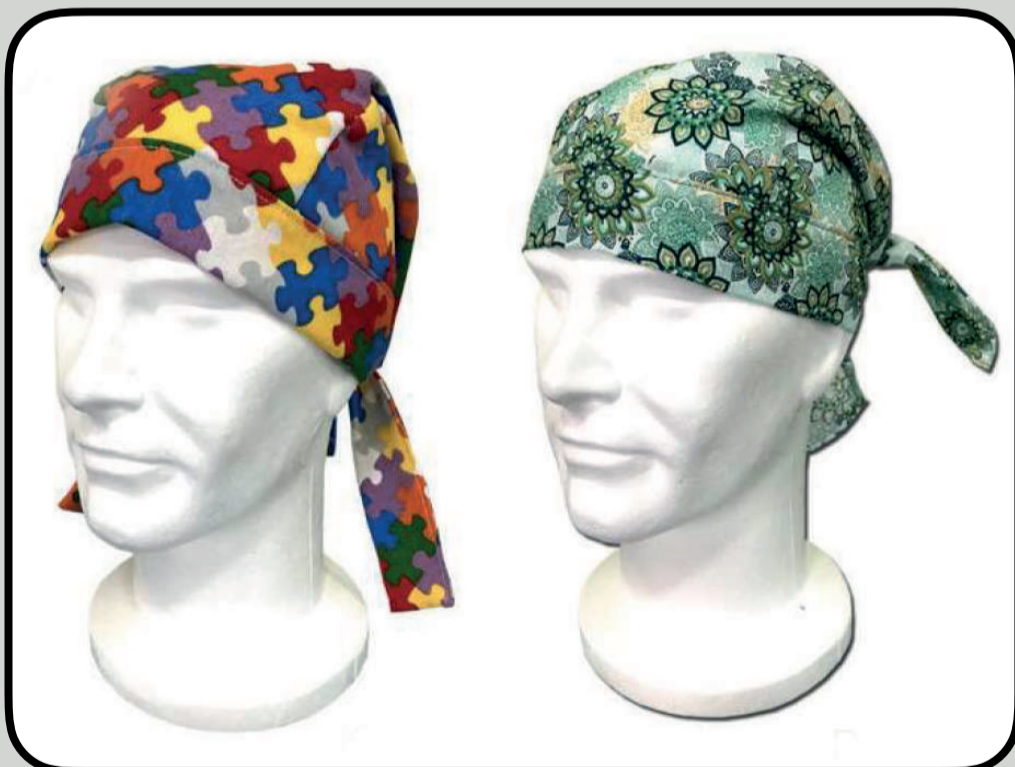
Diferentes estampados que se van actualizando